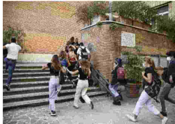
La corsa Sfida per accaparrarsi i banchi migliori

«Stringiamoci a coorte vuole dire stiamo insieme. Ricominciamo con grande gioia. È il giorno dell'accoglienza. Accogliamo tutti, questa è la cosa migliore», ha esortato il ministro dell'Istruzione Patrizio Bianchi incontrando i bambini della scuola Carducci di Bologna. «Non sarà più possibile mettere in dad una intera regione, se ci fossero fo-