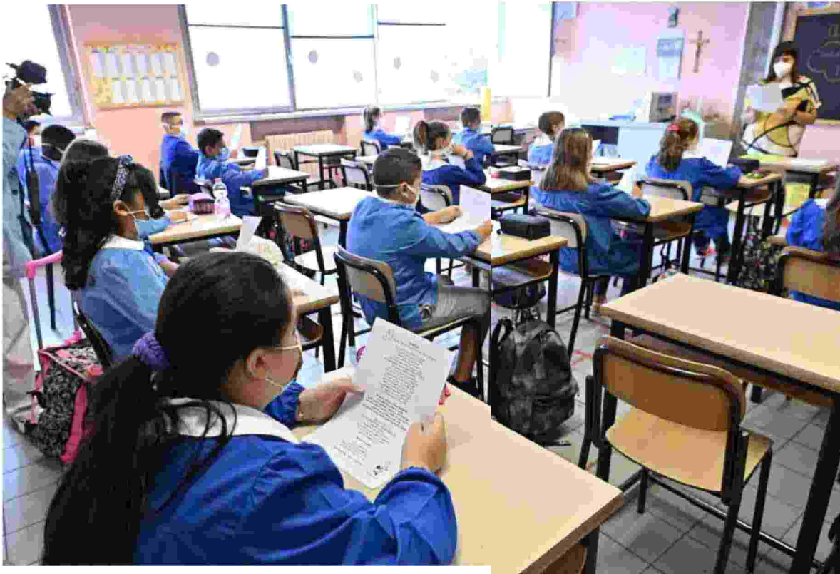
Primo giorno di scuola Bambini in un'aula della scuola elementare Erminio Franchetti di Torino ANSA