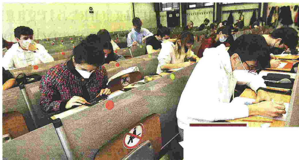
Didattica Milano, studenti universitari del Politecnico seguono una lezione in presenza

Il via libera in presenza dal 26 aprile esteso anche alle università Il 73% degli insegnanti è stato vaccinato ma le incognite restano