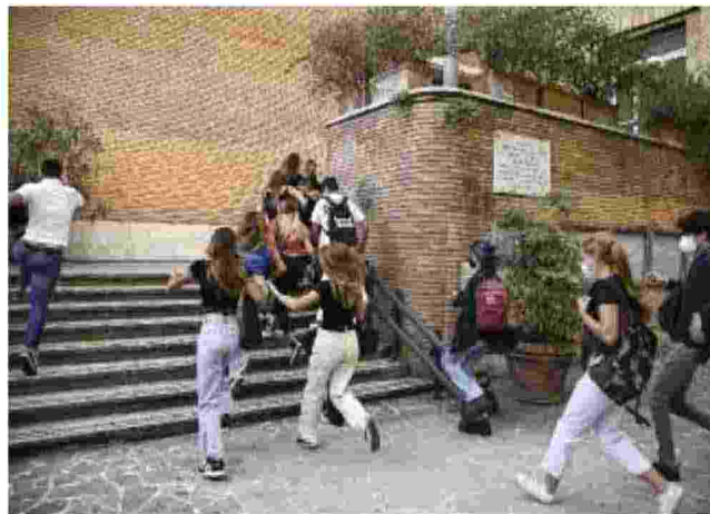
La corsa Sfida per accaparrarsi i banchi migliori

La ripresa della scuola in presenza, salutata con gioia da tutta la politica, causerà «un aumento della diffusione dell'infezione» ha affermato però il direttore di Malattie infettive del «Sacco» di Milano Massimo Galli. I trasporti in alcune realtà come Roma hanno ancora fatto registrare sovraffollamenti, ma il sottosegretario all'Istruzione Barbara Floridia assicura di aver lavorato a un progetto che metterà a disposizione di tutte le scuole italiane in tempi brevi un software in grado di supportare i mobility manager nella gestione dei flussi casa-scuola-casa.