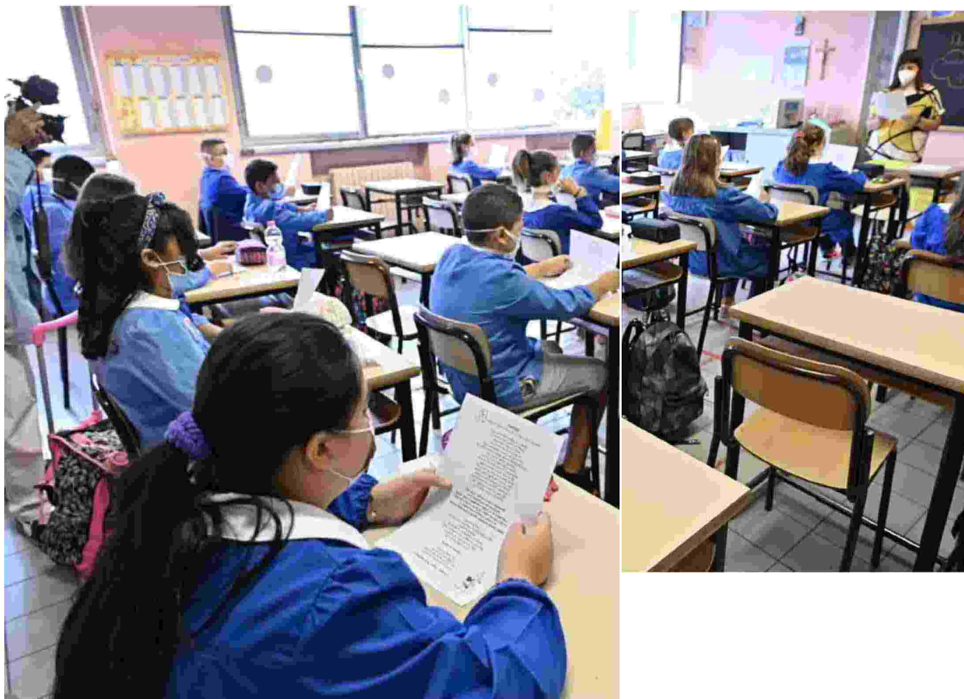
Primo giorno di scuola Bambini in un'aula della scuola elementare Erminio Franchetti di Torino ANSA.