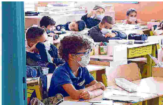
Scuola al via in nove regioni: il 94,3% del personale è vaccinato